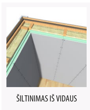
ŠILTINIMAS IŠ VIDAUS